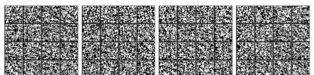
Tabella V.14-2: Compartimentazione